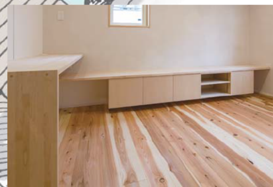
▲オプションにて、造作家具を使ったインテリアも含めたトータルコーディネート、全面バリアフリー住宅も可能