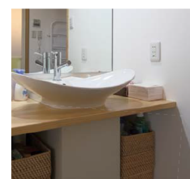
▲洗面台のシンクを選ぶのも注文住宅ならではの