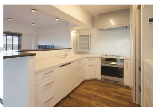
▲キッチンの高さや設備配置も使いやすく

注文住宅のように、理想の住まいを創る 「リノベーション条件付売マンション」という選択肢